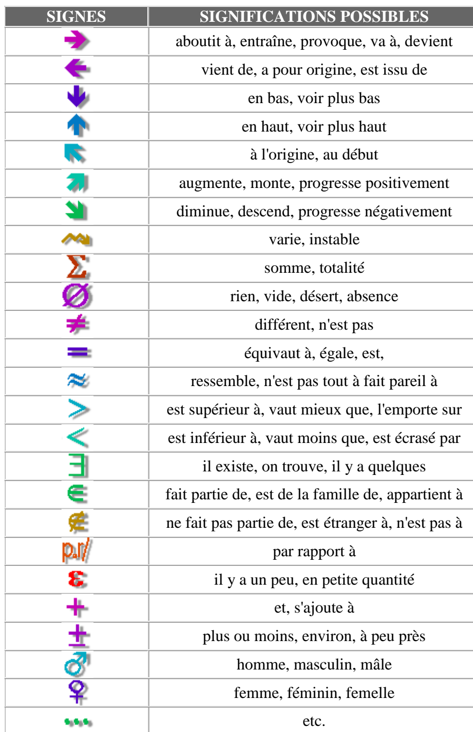
Tableau 01 : Les signes et leurs significations.

Exemple : Un nombre des signes proposés sont issus des mathématiques, voir tableau 01 .